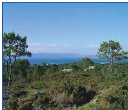
Ría de Arousa