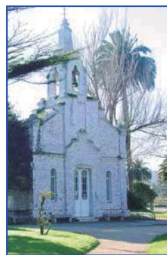
La Toja: Capilla