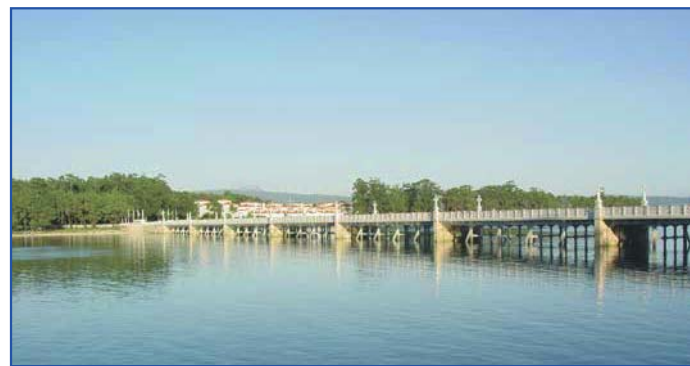
Puente de La Toja

ESCUELA INTERNACIONAL DE LENGUAS "RIAS BAJAS"