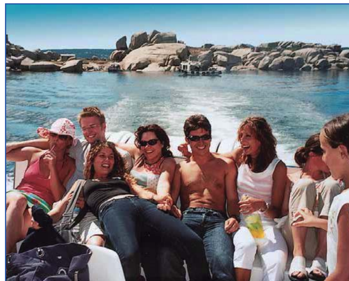
Excursión por la Ría de Arousa