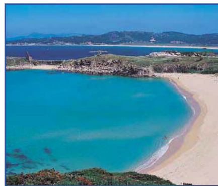
Playa Foxos y Lanzada (al fondo)