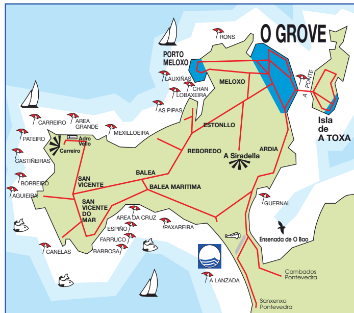
Playas de O Grove

Días festivos sin clases: 25.07.2018 y 15.08.2018.